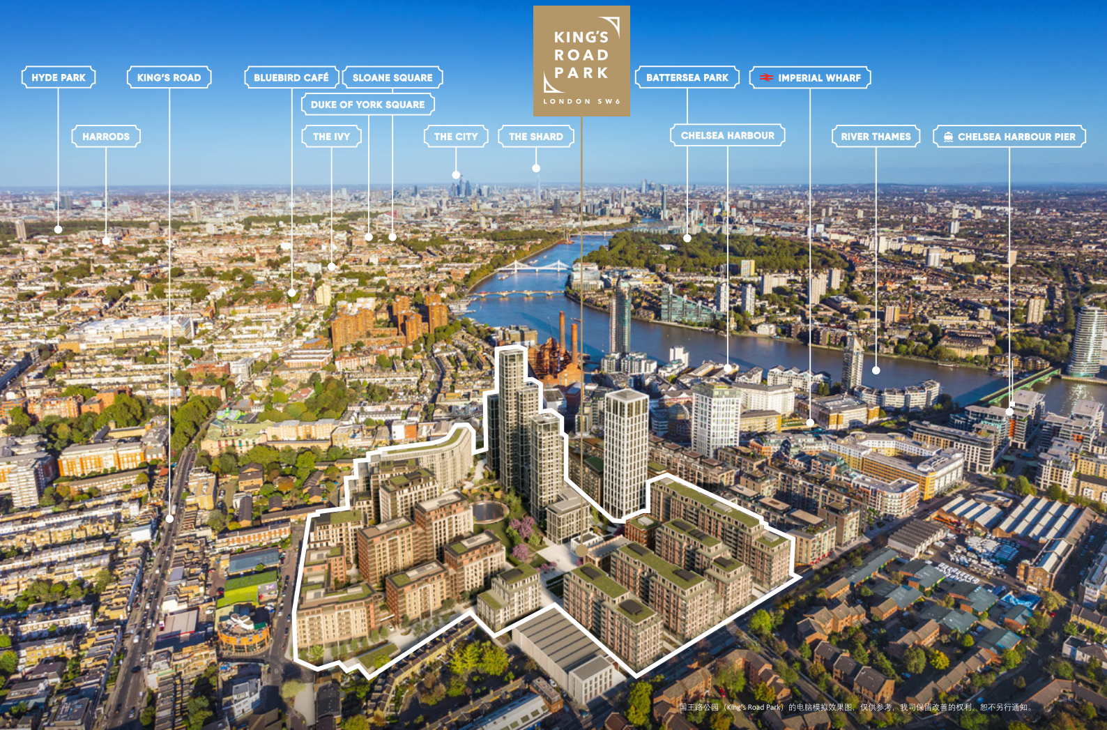
国王路公园 (King's Road Park) 的电脑模拟效果图, 仅供参考, 我可保留改善的权利, 恕不另行通知。