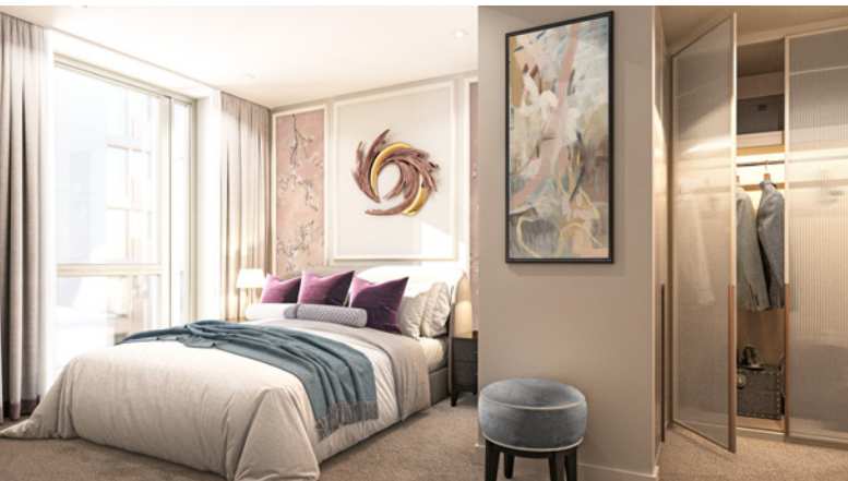
国王路公园 (King's Road Park) 的电脑模拟效果图, 仅供参考, 我可保留改善的权利, 恕不另行通知。