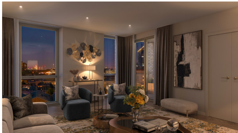
国王路公园 (King's Road Park) 的电脑模拟效果图, 仅供参考, 我可保留改善的权利, 恕不另行通知。