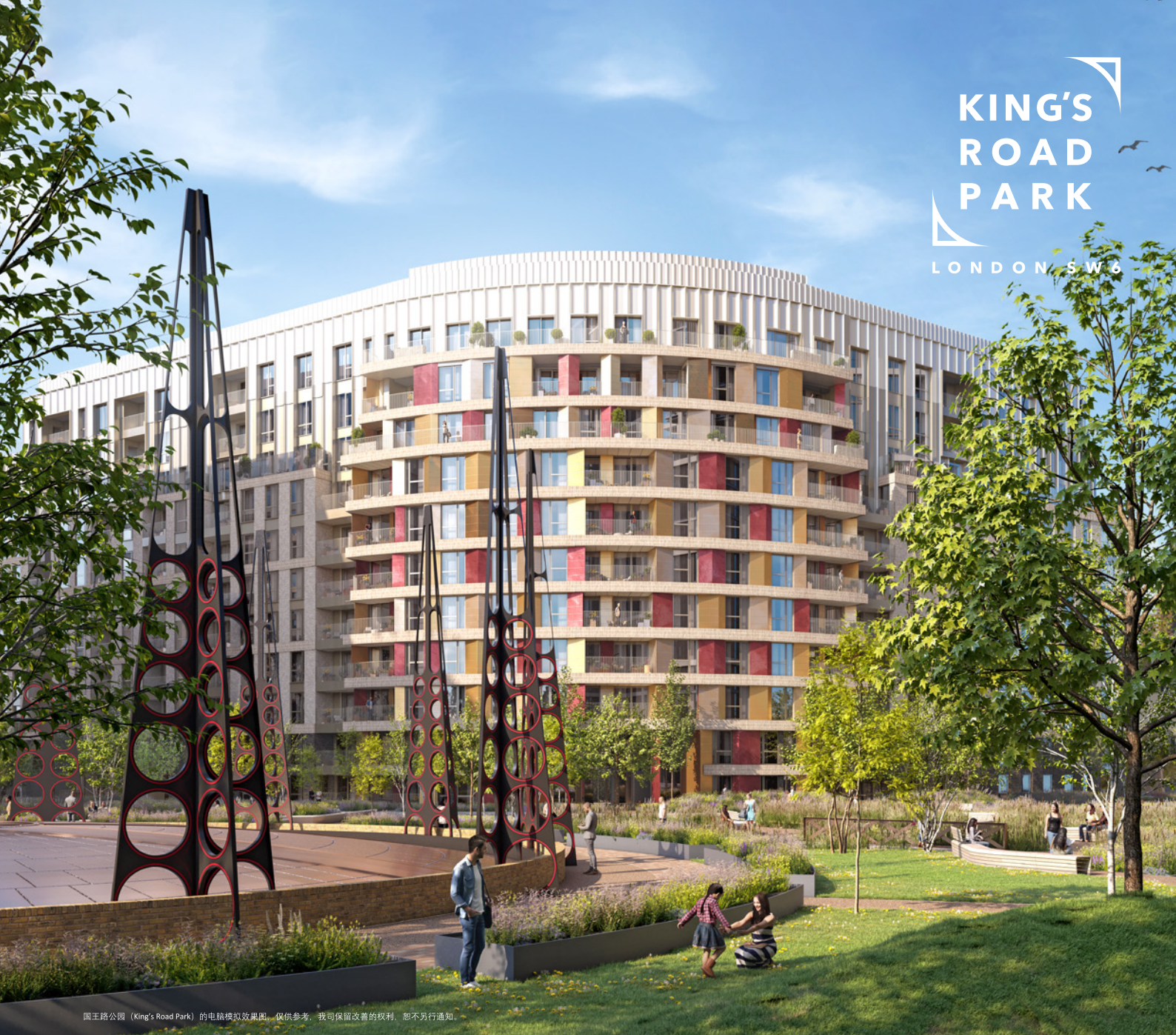
国王路公园 (King's Road Park) 的电脑模拟效果图。仅供参考，我司保留改善的权利。恕不另行通知。